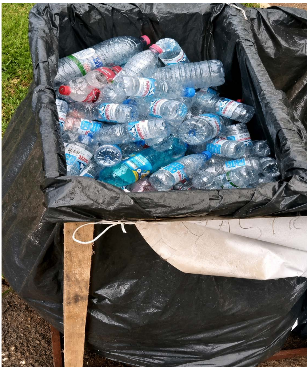
Figure 6. Regroupement des flux de PET pré-collectés dans un big-bag. Image agrandie et améliorée par l'éditeur avec assistance IA à des fins de lisibilité éditoriale ; les étiquettes des bouteilles en plastique demeurent toutefois illisibles, conformément à l'image originale fournie par l'auteur