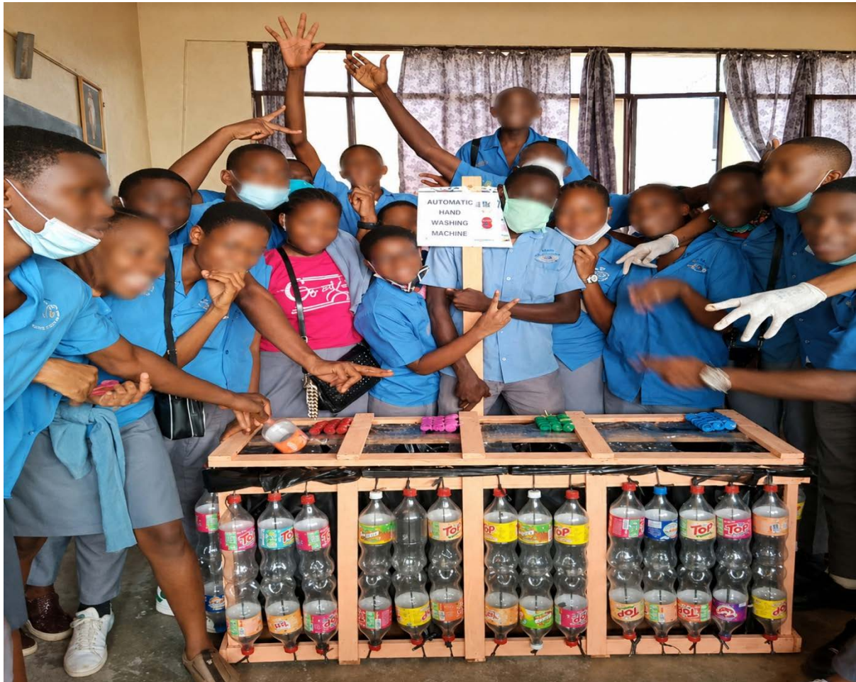
Figure 7. Des poubelles écologiques fabriquées par les élèves à partir de bouteilles PET et de chutes de bois, installées dans les écoles de Yaoundé.

formés ont participé activement à la fabrication de 20 poubelles de tri à partir de bouteilles plastique PET usées et de chutes de bois dans les écoles pilotes.