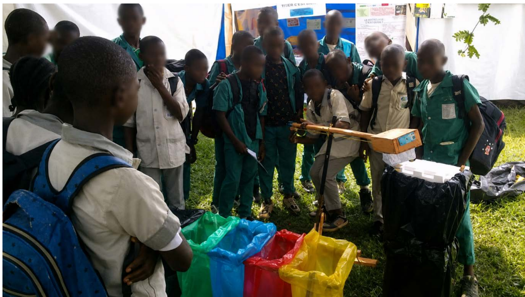
Figure 5. Match de tri entre élèves du secondaire.