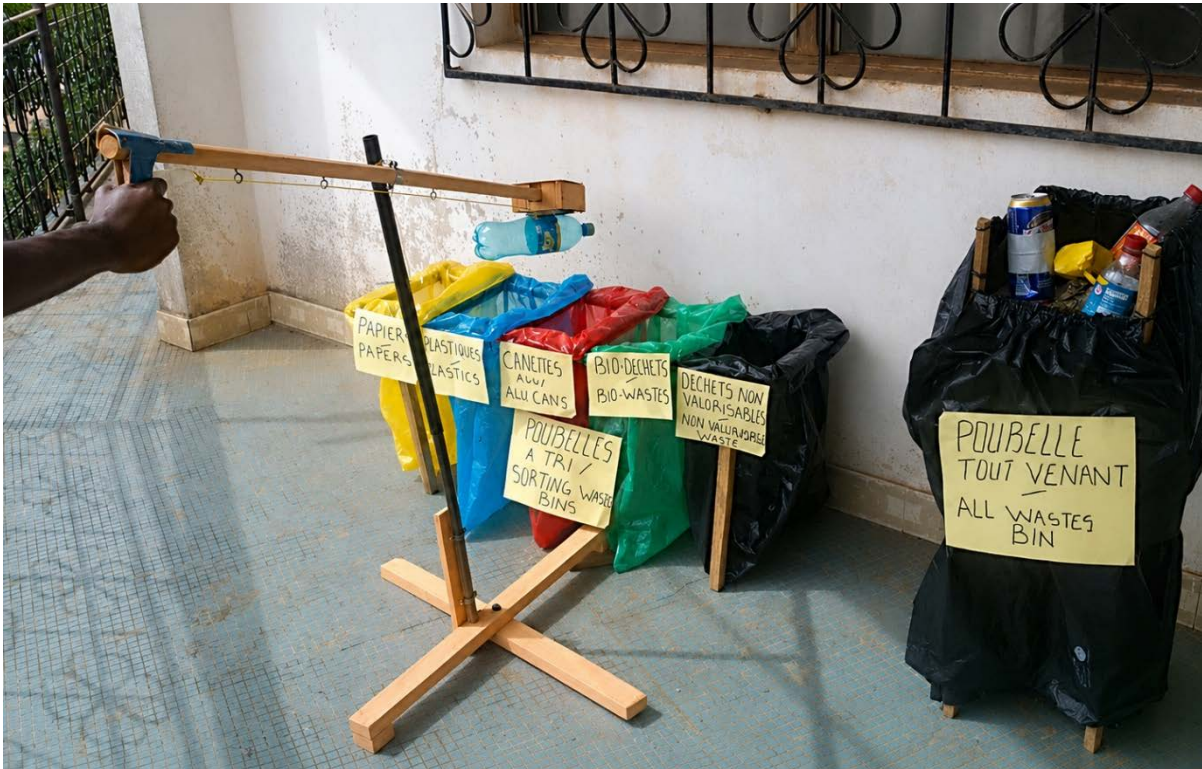
Figure 4. Prototype mécanique TRIKIDS. Image améliorée par l’éditeur, avec assistance IA, à des fins de lisibilité éditoriale. Aucun élément substantiel de la scène n’a été ajouté, supprimé ou modifié

Le Tableau 2 présente les caractéristiques de ce prototype mécanique facilitant l’apprentissage du tri sélectif.