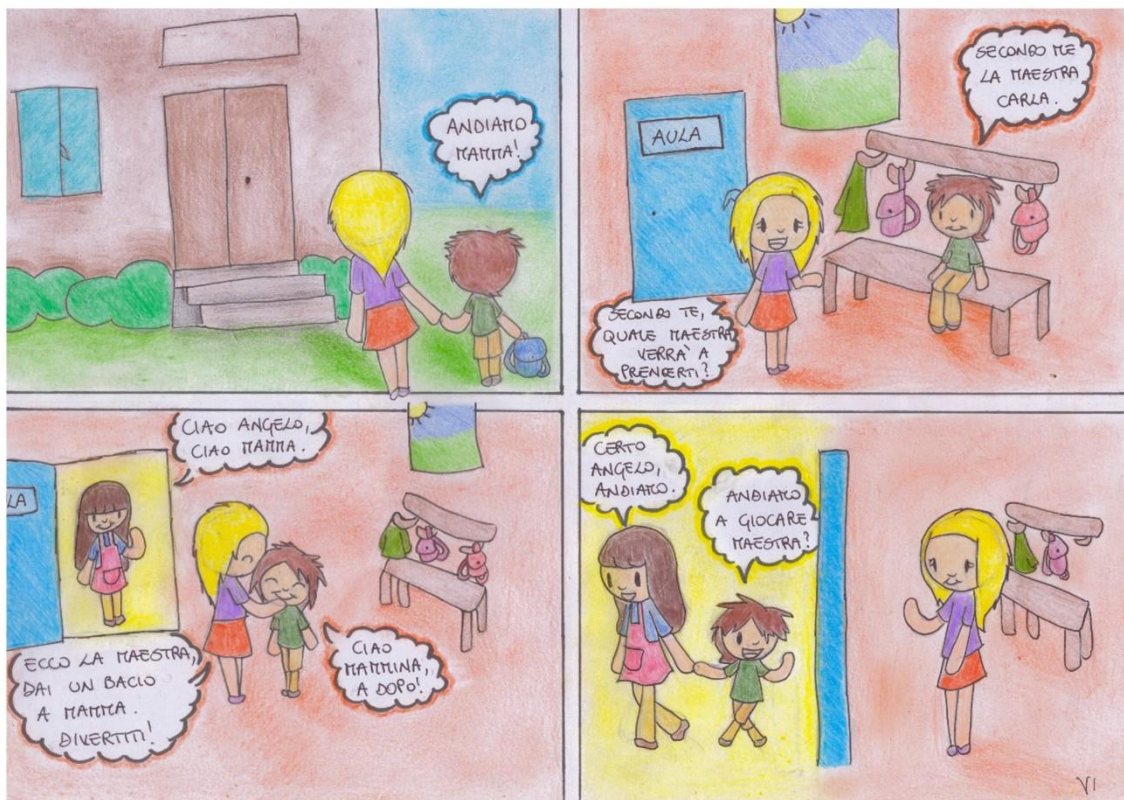
Figura 7. Configurazione di fiducia e contenimento emotivo nella separazione.