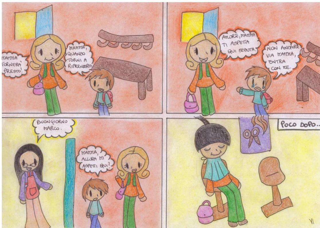
Figura 8. Configurazione di rassicurazione non pienamente aderente alla situazione.