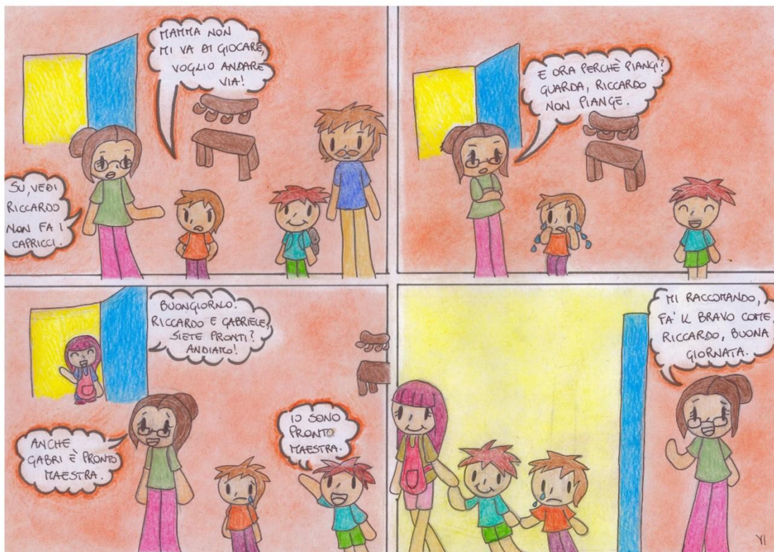
Figura 9. Configurazione comparativa nella lettura del comportamento infantile.