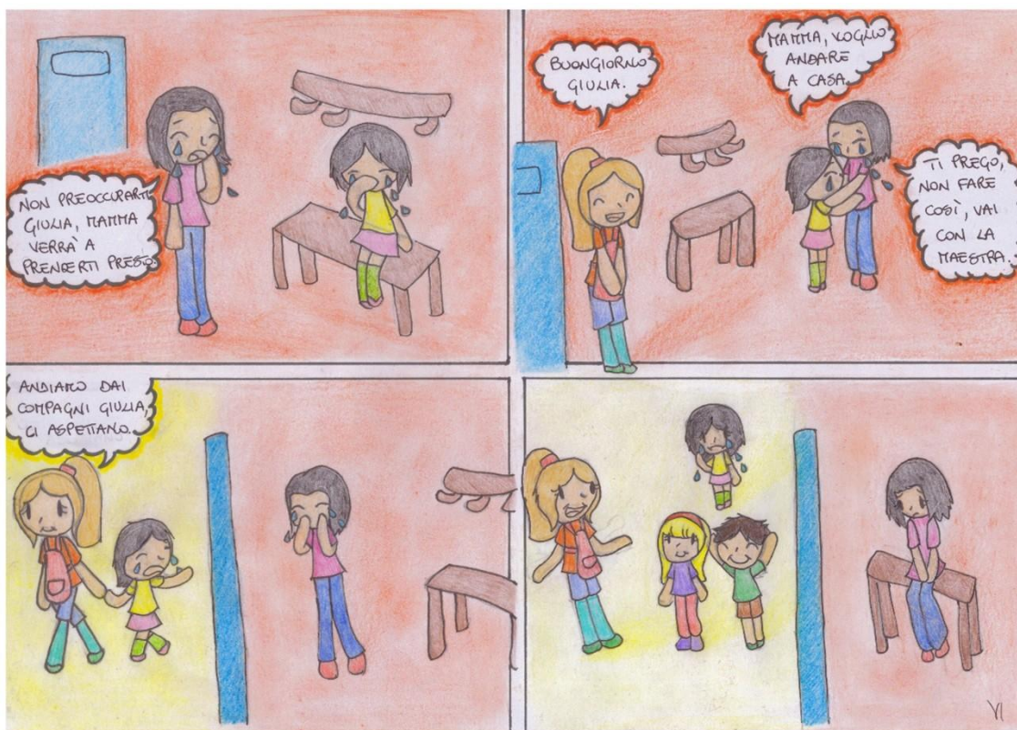
Figura 11. Configurazione di intensa partecipazione emotiva alla separazione.