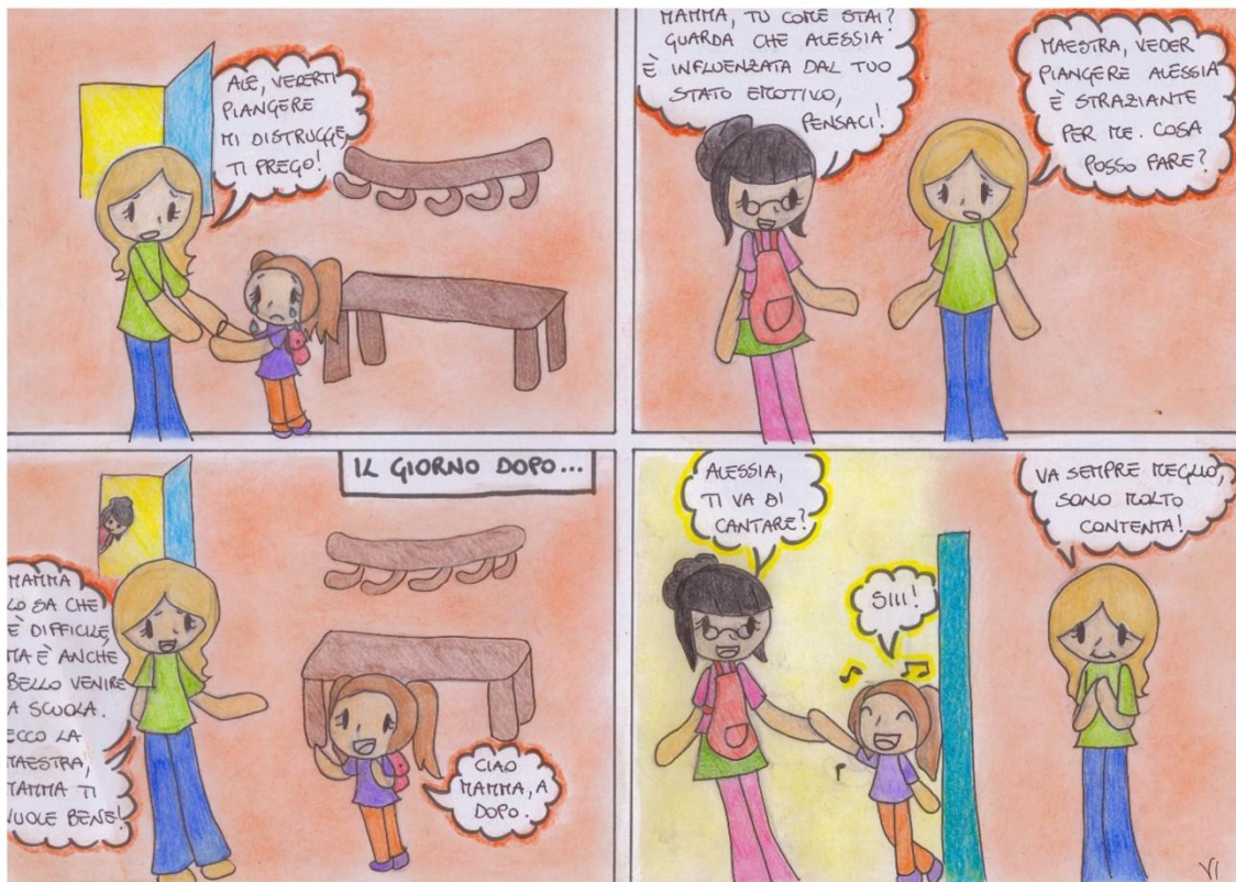
Figura 6. Configurazione di richiesta di sostegno e confronto educativo.