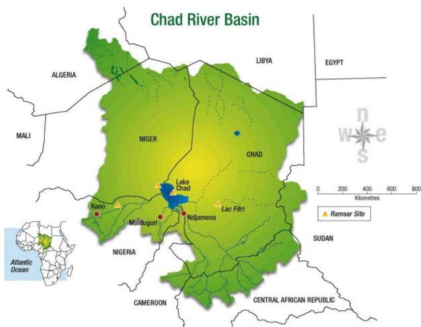
Figure 2: Situation géographique du bassin du lac Tchad

Le bassin du lac Tchad couvre une superficie de 2 500 000 km 2 qui correspond à environ 8% de la superficie du continent africain, se situe entre 6° et 24° N et 8° et 24° E et se répartit entre l'Algérie, le Cameroun, la République centrafricaine, le Tchad, la Libye, le Niger, le Nigeria et le Soudan. Son bassin Conventionnel quant à lui couvre 967 000 km 2 et regroupe les pays membres de la CBLT (Cameroun, République centrafricaine, Tchad, Niger, Nigeria et la Libye).