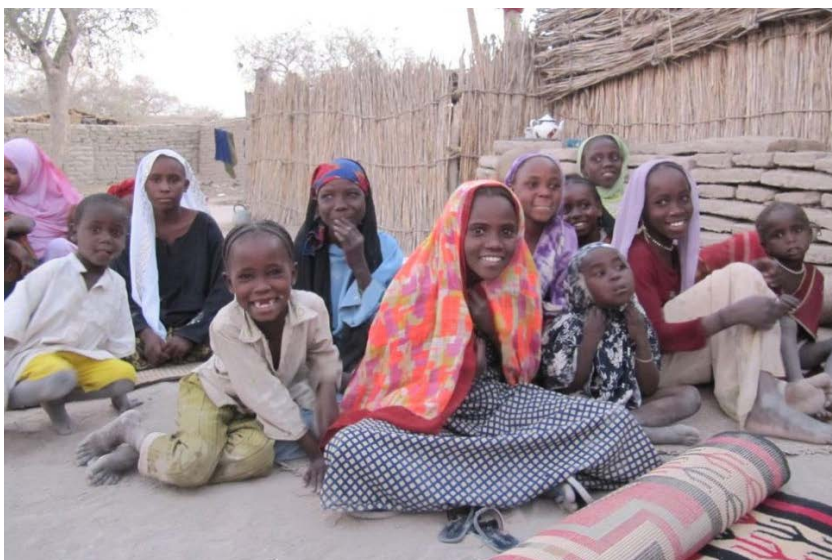
Figure 3 : Population locale du Bassin du Lac Tchad

La vision actuelle du PAS ne peut vouloir lutter contre l'assèchement du lac Tchad sans investir sur le capital humain endogène. La résolution de problèmes du lac Tchad nécessite des professionnels, des ingénieurs qui vont travailler pour mettre au point des innovations technologiques qui vont servir pour sauver le lac Tchad de l'assèchement. A ce titre, l'ingénierie est l'un des principaux moteurs de la résolution des problèmes du lac Tchad qui devrait particulièrement intéresser la CBLT.