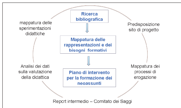
Fig. 1. Articolazione della prima annualità di progetto PRODIG

Da questi elementi di contesto locale e globale, sarà possibile predisporre un piano formativo rivolto al personale neoassunto dell'Ateneo.