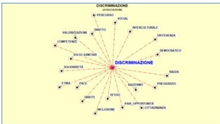
Figura 1. Associazioni di parole per ‘discriminazione’ nel Corpus di analisi

Un’ulteriore riflessione che qui presentiamo riguarda l’uso della forma femminile e della forma maschile nel corpus. Le Linee guida dedicano al tema un intero paragrafo (§2) con questo esordio: «Un’altra forma di violenza simbolica è cancellare la differenza in nome di una presunta uguaglianza che è in realtà un adeguamento al modello maschile» (p. 7). L’analisi delle forme maschili e femminili dei lemmi “alunno” e “bambino”, soggetti delle azioni educative, permette di ottenere un primo dato relativo all’assoluta predominanza d’uso della forma maschile (Fig. 2). Nel caso di ‘alunno’ a fronte di 13.578 occorrenze del lemma nel corpus, il 99% (13.405) si riferiscono alla forma maschile, nel caso di ‘bambino’ (2.355 occorrenze) tale percentuale si abbassa un poco, passando al 98% (2.297 occorrenze).