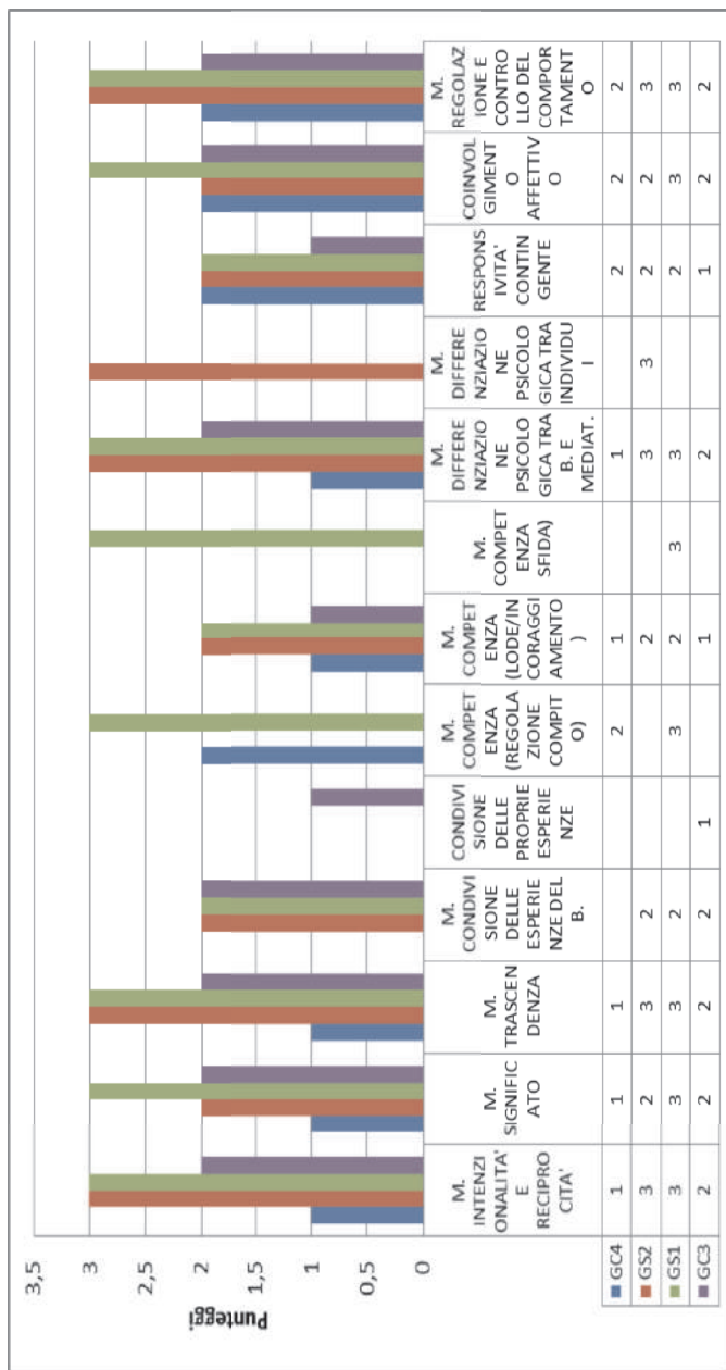
Grafico 2. Post-test/2 relativo alla qualità della mediazione degli insegnanti