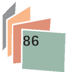
Tab. 2: Docenti neo-assunti in fase C iscritti ai poli formativi