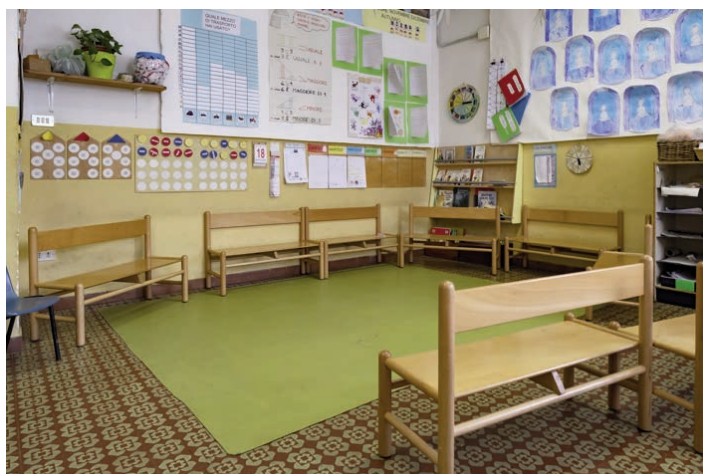
Fig. 2: L'angolo delle panchine in un'aula della scuola primaria di Rimaggio

Un elemento distintivo dell’aula è lo spazio dedicato alle panchine: si tratta di una zona allestita con sedie (di altezze diverse in base all’età o cuscini disposti in semicerchio) utilizzata per le attività di accoglienza, di relax e soprattutto di dialogo (circle time) e discussione tra bambini e tra bambini e docenti.