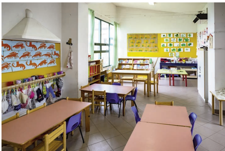
Fig. 1: Un esempio di aula differenziata

Il modello pedagogico che si consolida a Bagno a Ripoli influenza la configurazione dello spazio d'aula ed evidenzia come il modo in cui gli spazi vengono allestiti sostenga lo svolgimento di attività didattiche di tipo attivo e cooperativo (Tosi, 2019, p. 69).