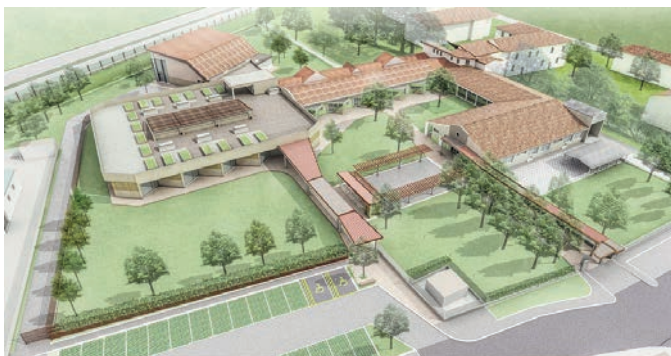
Fig.4: Il progetto di ampliamento del plesso di Padule

Le interviste che per questo studio di caso abbiamo realizzato con le docenti dell'Istituto Comprensivo, con il Dirigente dei Servizi ai Cittadini del Comune di Bagno a Ripoli e con l'Architetto del Comune hanno evidenziato come questo modello di scuola abbia costituito un punto di riferimento prezioso su cui innestare ogni cambiamento.