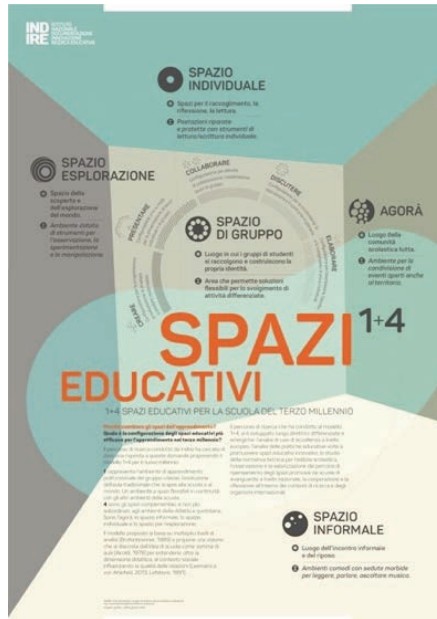
Fig. 5: Il Manifesto "1+4 spazi educativi per la scuola del terzo millennio" elaborato da Indire

L'istituto di ricerca di cui chi scrive fa parte, oltre a partecipare alla stesura delle Linee Guida del MIUR (2013), ha all'attivo da anni una linea di ricerca dedicata alle Architetture scolastiche 4 ; in questo ambito ha elaborato il Manifesto "1+4 spazi educativi per la scuola del terzo millennio", uno strumento molto diffuso nelle scuole e fra il personale tecnico degli enti locali.