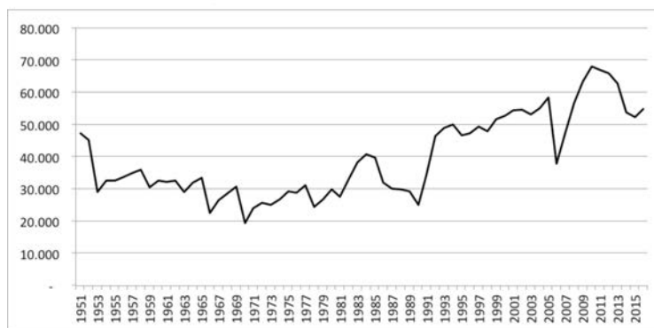
Gráfico 1 – Detenuti presenti a fine anno in Italia. Anni 1951-2016 (valori assoluti).