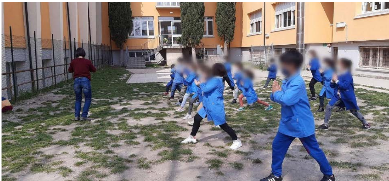
Figura 1. Educazione alla corporeità in giardino

Per avviare le attività gli alunni sono stati all'aria aperta nel giardino della scuola. Si sono seduti sull'erba per avere un contatto diretto con la natura. Inizialmente è stato deciso di utilizzare una campana tibetana per dedicarsi all'arte del silenzio. Silenzio non inteso come una punizione, ma come un momento fondamentale per poter pensare a loro stessi, per prendersi una pausa dalla frenesia della quotidianità. I bambini, in un primo momento incuriositi, non capivano come fare: cosa significa stare in silenzio e fermi? Saper controllare il proprio corpo in una posizione a lui congeniale per circa un minuto richiede di poter liberare la mente da qualsiasi pensiero e non è facile per bambini abituati ad essere in un ambiente dove ci sono rumori, suoni e stimoli per tutta la giornata. Dopo vari tentativi e prove, questa attività è risultata molto benefica per gli alunni e si è potuto ottenere una prima comprensione del proprio corpo, della propria corporeità. I bambini hanno poi eseguito esercizi di allungamento degli arti superiori e inferiori e di conoscenza di tutti quei muscoli che si utilizzano automaticamente ma senza cognizione.