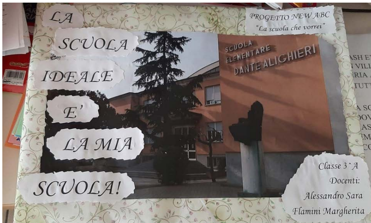
Figura 2. Copertina della storia

Gli alunni hanno poi scritto tutta la storia insieme alle insegnanti e in seguito rappresentato sotto forma di disegno. Dietro le tavole sono state attaccate delle didascalie che sarebbero state lette nel momento della messa in scena della storia.