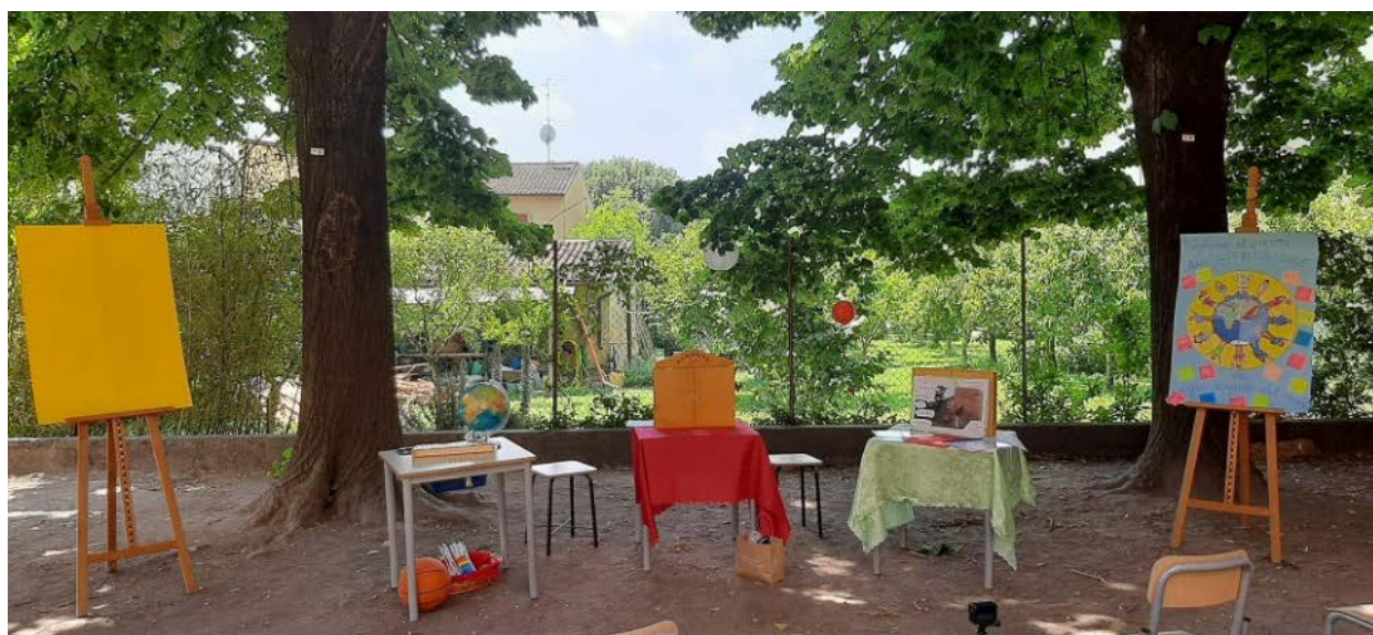
Figura 3. Allestimento rappresentazione

Inizialmente si è potuta cogliere l'agitazione e l'emozione nei volti dei bambini, ma una volta cominciata la narrazione tutto si è svolto con naturalezza e spontaneità. Al termine della rappresentazione teatrale, i bambini hanno iniziato a descrivere al pubblico come è nata la storia, come hanno realizzato i disegni e le attività svolte insieme alla prof.ssa. Tanti bambini hanno mostrato l'esigenza di poter parlare, poter dare un loro contributo, far capire ai genitori che dietro a questa lettura c'è stato tanto lavoro, ma anche tanto divertimento. Ci sono state molteplici testimonianze, racconti e descrizioni. Gli alunni volevano essere ascoltati, rappresentati, desideravano che il loro impegno, la loro determinazione e la loro costanza nel lavoro fosse condivisa. Non vi è stato un sovrapporsi di voci, ma un rispetto e un'attesa reciproca nel poter condividere la propria opinione agli adulti, anche grazie ad una maggiore consapevolezza maturata nel corso del progetto. Ogni alunno ha espresso il proprio punto di vista ascoltando quello degli altri e apportando poi il proprio contributo. Un bel momento sia per i bambini che per gli adulti.